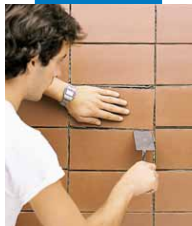
Время корректировки плитки – до 60 минут