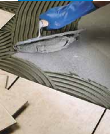
Укладка плитки ординарного обжига в качестве полового покрытия