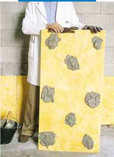
Клеевое крепление изоляционных панелей на неотделанную стену

Список значимых объектов использования данного материала доступен по требованию