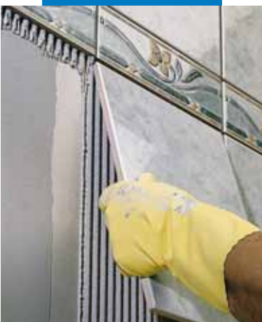
Укладка плитки ординарного обжига в качестве стенового покрытия поверх гипсовых панелей