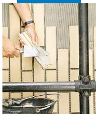
Укладка обшивки снаружи Прим.: Хорошо заполнять клеем заднюю поверхность обшивки